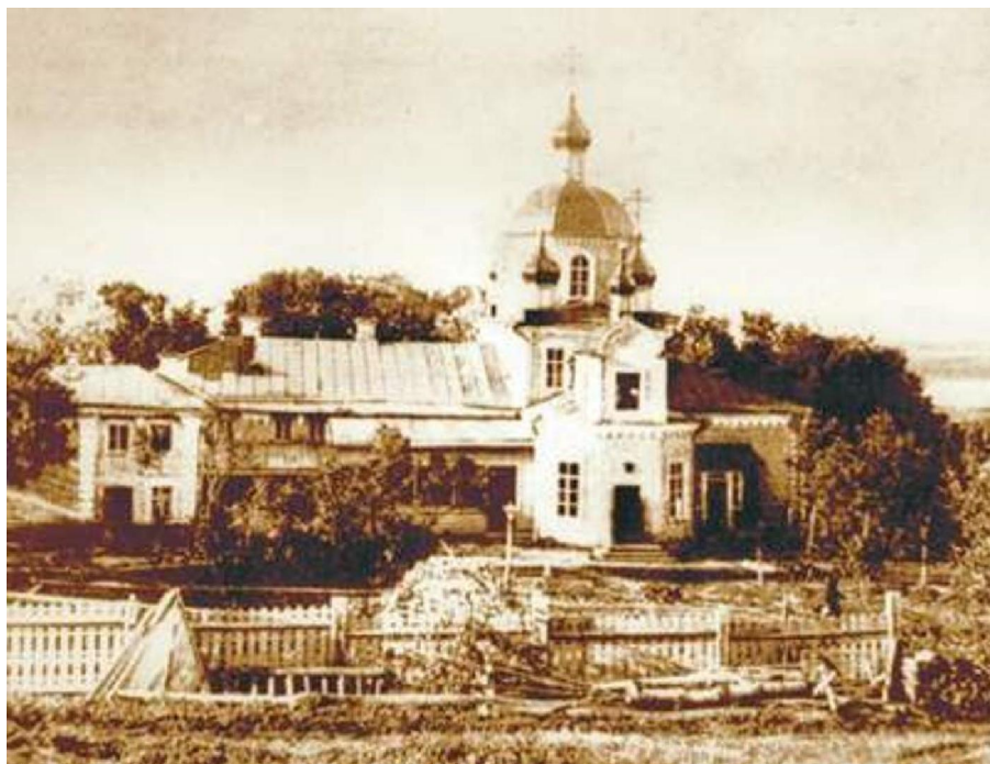
1. Скитской храм святителя Алексия митрополита Московского Фото сделанное между 1880-1913