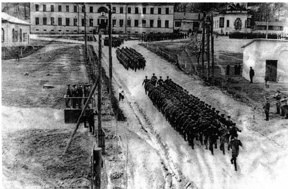
11. Военнослужащие на территории Спасо-Преображенского монастыря Фото 1943-1944 года