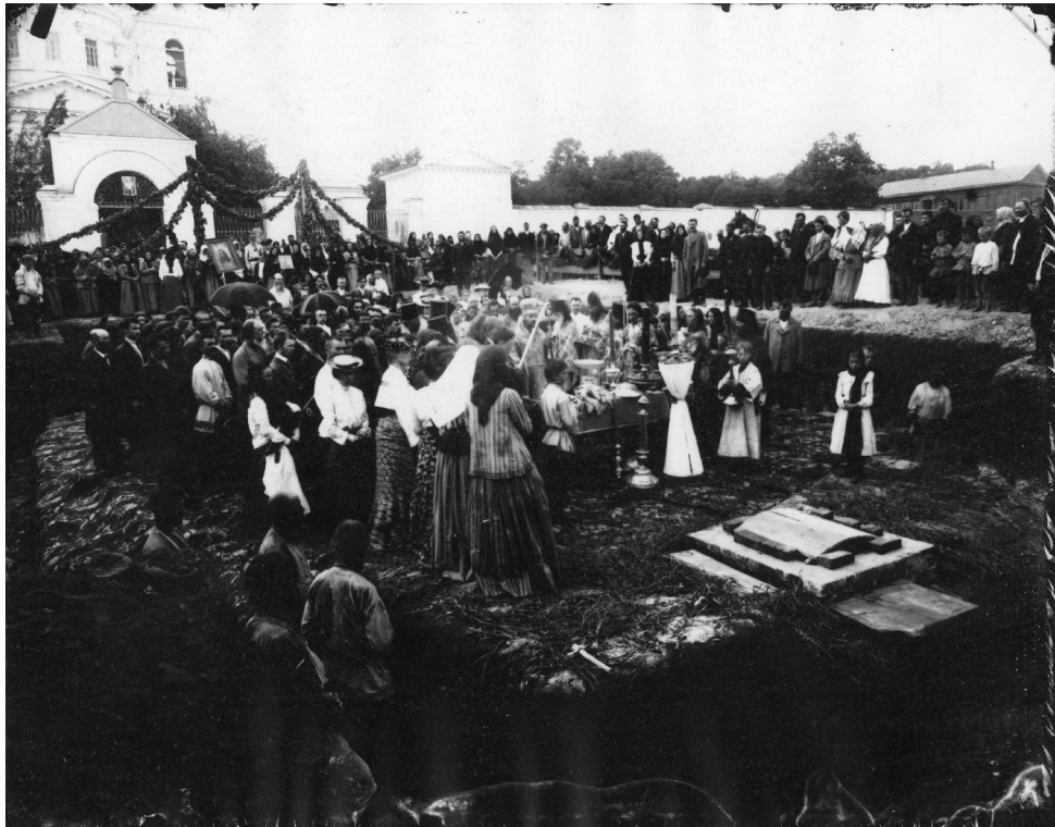
7. Закладка колокольни Спасо-Преображенского монастыря. Фото 1903 года