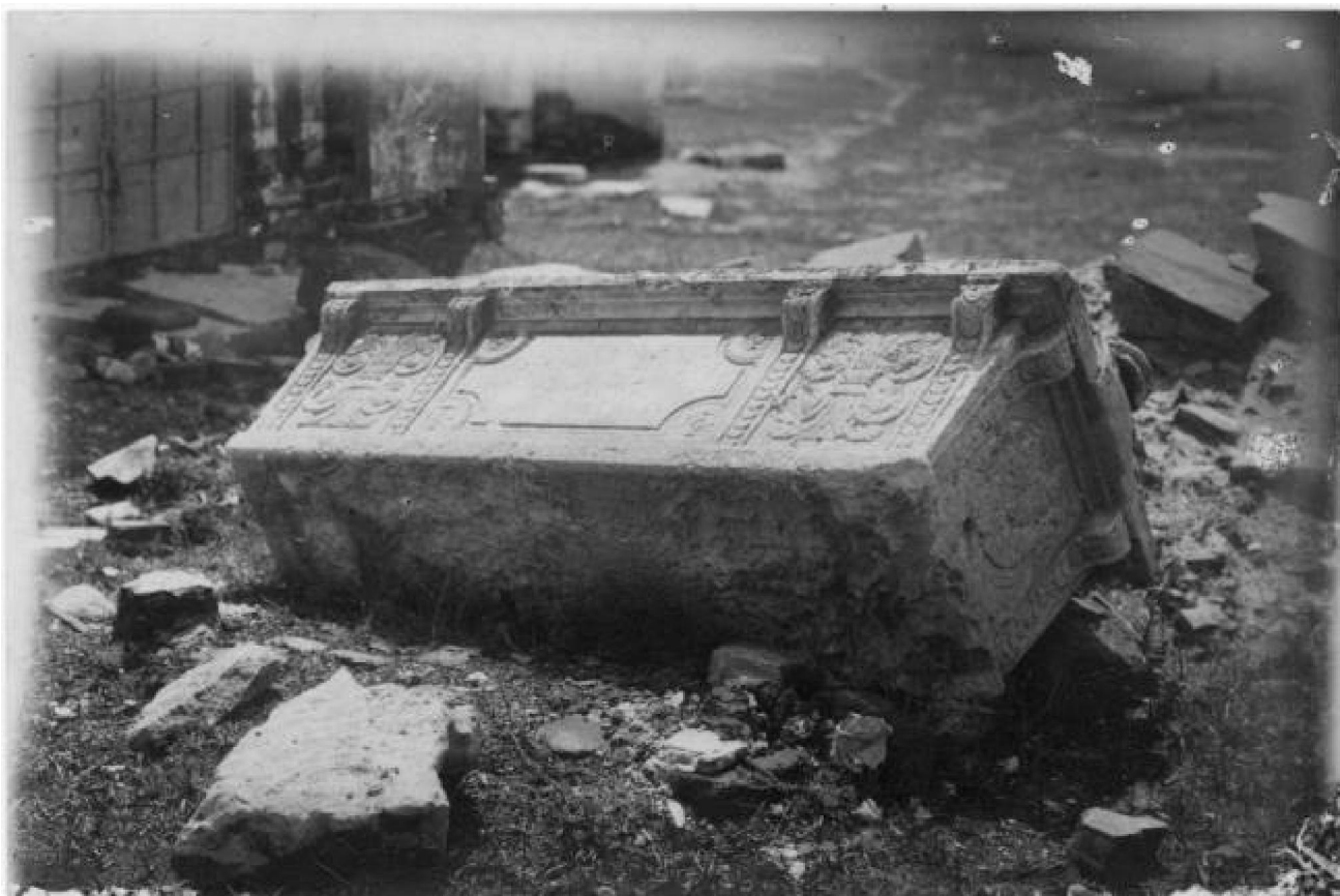
12. Разрушенные памятники на территории обители