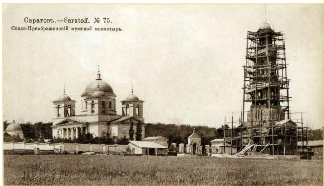
8. Строительство колокольни в Спасо-Преображенском монастыре. Фото сделанное между 1903-1904 годом.