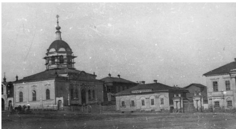
2. Храм Страстей Господних (Киновия), подворье Спасо-Преображенского монастыря Фото сделанное между 1860-1885