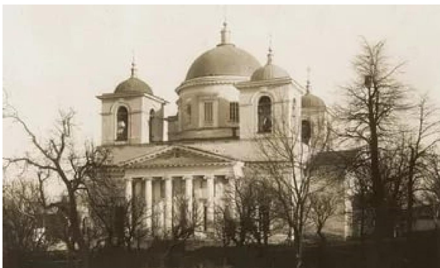
3. Спасо-Преображенский собор нового монастыря Фото конца XIX века.