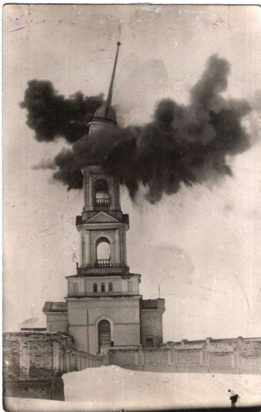
9. Взрыв колокольни Спасо-Преображенского монастыря Фото 03.04.1929 год